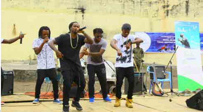
Prestation du célèbre Groupe de rap KIFF NO BEAT