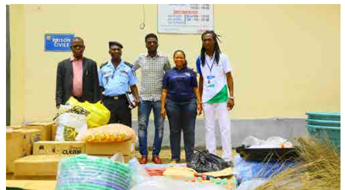
l'Opération Prison Propre et Concert à la Maison d'arrêt et de correction de Grand-Bassam.