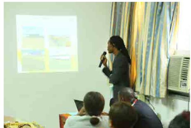
Conférence de présentation du projet "Voisins Solidaires