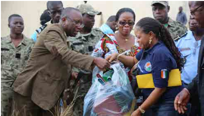
Remises des dons