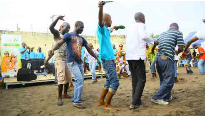
Les détenus en piste de danse