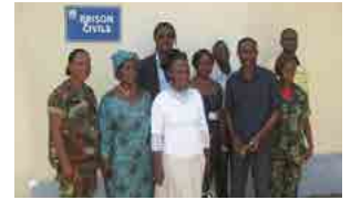
La visite de prospection à la prison civile de Bassam le 11 Avril 2012