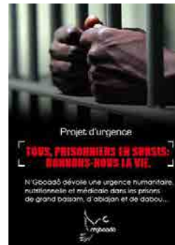
Projet d'urgence « Tous, prisonniers en sursis : DONNONS NOUS LA VIE »