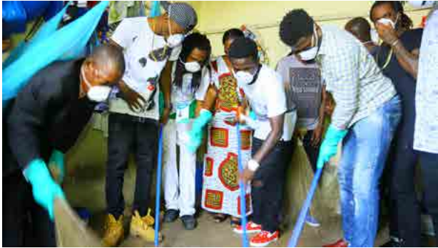
L'étape du nettoyage des cellules avec les honorables invités